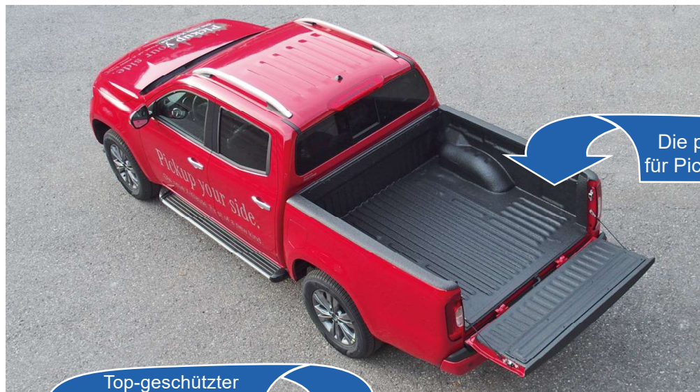
Die perfekte Lösung für Pickup-Ladeflächen