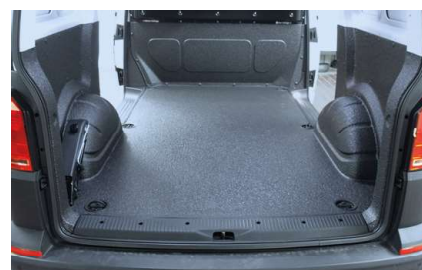
Optimale Lösung für Ihr Nutzfahrzeug